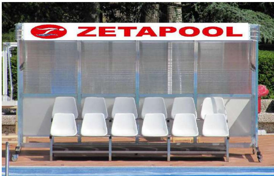
TETTOIA PANCHINA GIOCATORI PALLANUOTO WATERPOLO PLAYERS BENCH CANOPY