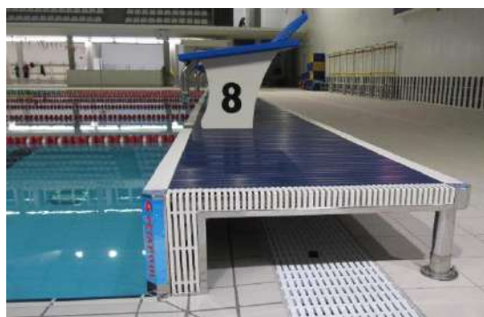
TESTATA AMOVIBILE OPEN FACE PLATFORM