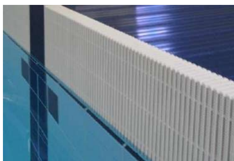
GRIGLIE E DOGHE GRIDS AND STAVES