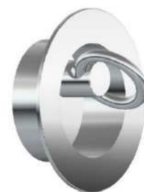
AGGANCIAMENTO CORSIA HOOKS FOR LANE