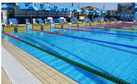
CORSIA FRANGIONDA BREAKWATER LANE